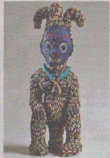
La regina, la maternità, re e regina: nelle foto di Antonio Cozza alcune delle statue in mostra